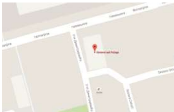
Mapa lokacije Prekršajnog suda u Požegi